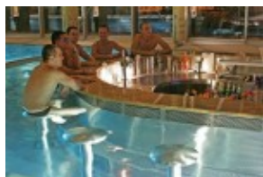
AquaCity - bar przy basenie