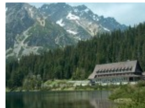
Popradské Pleso za schroniskiem