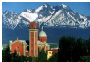
Kezmarok - Kościół Ewangelicki i Tatry:)