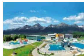
AquaCity Poprad - widok ogólny