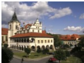
Lewocza / Levoca - Ratusz