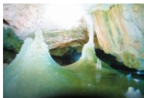
Dobsinska Jaskinia Lodowa