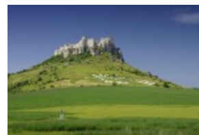
Zamek Spiski - Spissky Hrad