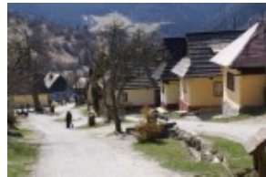
wioska Vlkolinec (Unesco)