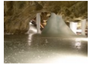
Jaskinia Lodowa - Dolina Demianowska