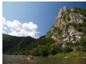
Rzeka Wag i Zamek Strecno