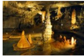
Jaskinia Wolności - Dolina Demianowska