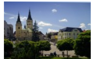
Žylna - Zilina