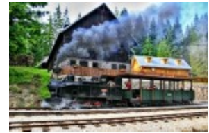
Kolejka na przełęcz Beskyd