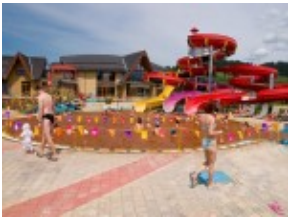
Besenova - baseny termalne