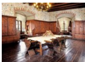
Zamek Orawski - wnętrza