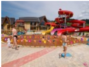
Besenova - baseny termalne