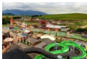
Tatralandia - relaks na basenach