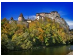
Zamek Orawski z zewnątrz