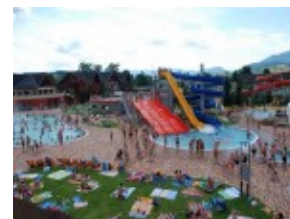
Besenova - baseny relaksacyjne