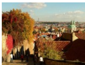
Praga - Zamkowe Schody