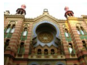
Synagoga Jubileuszowa w Pradze