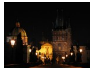
Praski Most Karola nocą