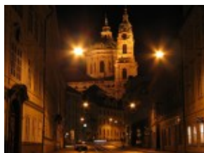
Mala Strana - Kościół św. Mikołaja