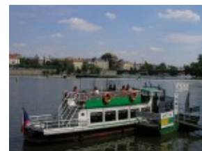
Rejs po Wełtawie