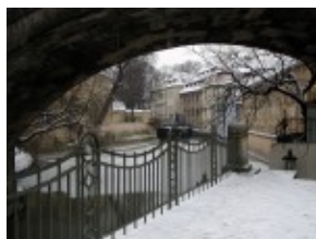
Uroczy zakątek w Pradze