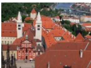
Hradczany - widok z katedry św. Wita