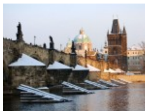
Most Karola w Pradze