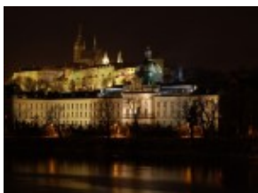
Praga - Hradczany i Akademia Strakova