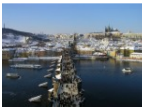
Praga - Most Karola i Wełtawa