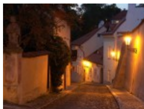
Praga - ulica Valdstejska