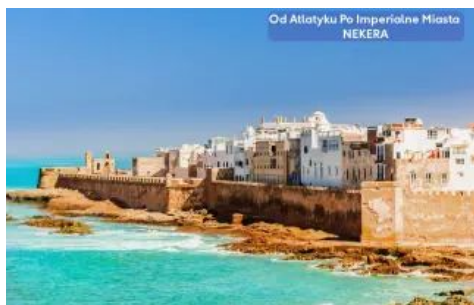
Od Atlantyku Po Imperialne Miasta NEKERA