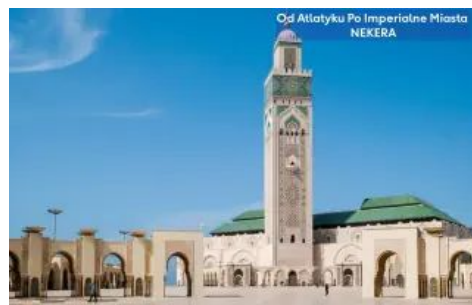
Od Atlantyku Po Imperialne Miasta NEKERA