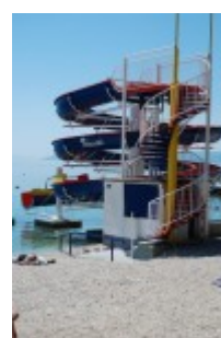
Atrakcje na plaży

MAKARSKA - serce Makarskiej Rivijery , tętniące życiem do późnych godzin nocnych miasto, oferuje wszystko, czego pragnie turysta chcący w ciągu dnia odpoczywać, a wieczorem spędzić czas w restauracjach, kafejkach czy też dyskoteci.