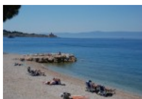
Plaża hotel Rivijera