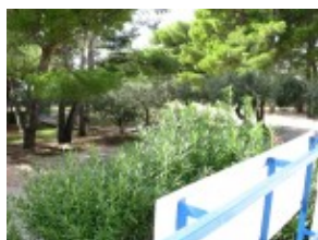
widok z balkonu