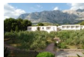
pawilony Elwira w otoczeniu zieleni