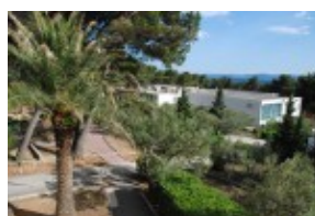
widok z ogrodu