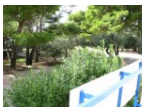
widok z balkonu