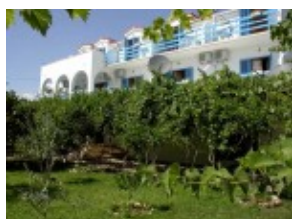
HVAR Pensjonat JADRANKA