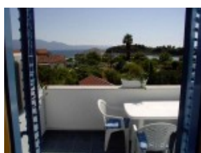
Widok z balkonu