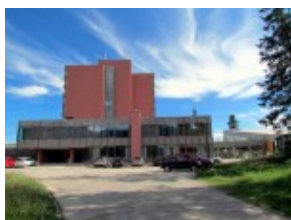
Hotel TRIGAN*** Strbské Pleso