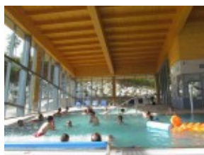
Hotel TRIGAN*** - basen relaksacyjny