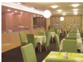
Hotel TRIGAN*** - restauracja