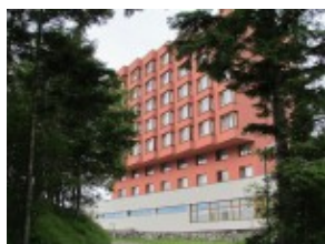
Hotel TRIGAN*** Strbske Pleso