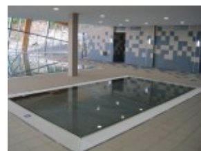
Basen dla dzieci w hotelu TRIGAN***

Hotel zlokalizowany jest w atrakcyjnej okolicy Tatr Wysokich w osadzie Nowe Strbské Pleso na terenie Tatrzańskiego Parku Narodowego, który jest najważniejszym rezerwatem przyrody na terenie Słowacji. Z kolei Strbské Pleso jest popularnym rekreacyjno-turystycznym ośrodkiem Tatr Wysokich, a jednocześnie najwyżej położonym uzdrowiskiem środkowej Europy z klimatycznie najbardziej czystym powietrzem.