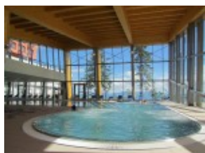
Wellness centrum w hotelu TRIGAN***