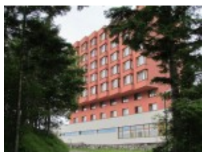
Hotel TRIGAN*** Strbské Pleso