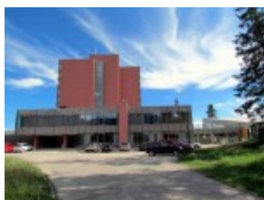
Hotel TRIGAN*** Strbske Pleso