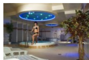
Jacuzzi w hotelu TITRIS***

Hotel *** Titris położony jest w cichej okolicy w pobliżu centrum Tatrzńskiej Łomnicy, jednej z większych osad tatrzańskich i znanego centrum społeczno-kulturalnego Wysokich Tatr. Znajduje się w pobliżu ogrodu botanicznego z ekspozycją tatrzańską przyrody a także Muzeum Tatrzńskiego Parku Narodowego. Hotel Titris jest oceniony Certyfikatem „ Ośrodek przyjazny dla rodzin i dzieci ”. Ważność certyfikatu jest na bieżąco kontrolowana na podstawie stanu proponowanych usług.