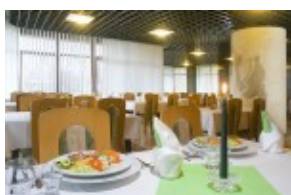
Hotel TITRIS*** - restauracja