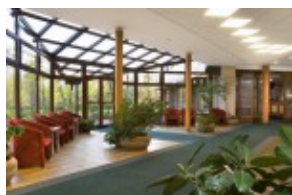
Hall recepcyjny w hotelu TITRIS***