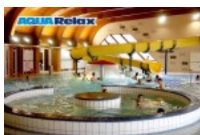
Zjeżdżalnia w AquaRelax TITRIS***