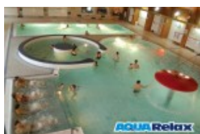
AquaRelax przy hotelu TITRIS***