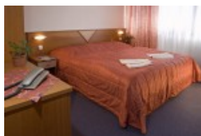
Przykład pokoju w hotelu TITRIS***