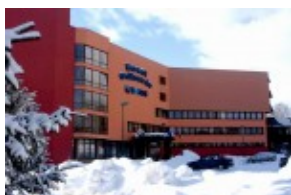
Hotel TITRIS*** Tatranska Lomnica