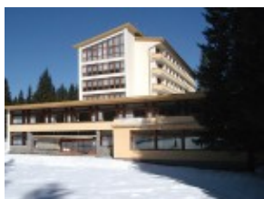
Hotel SNP*** Jasna pod Chopokiem