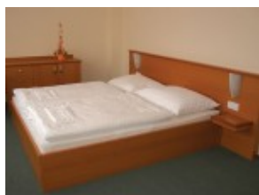
Przykład pokoju w hotelu SNP***