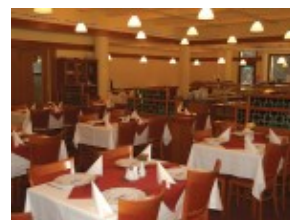
Hotel SNP*** - restauracja