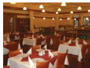
Hotel SNP*** - restauracja