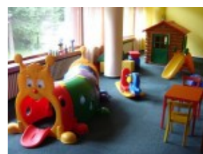
Coś dla dzieci w hotelu SNP***

Hotel SNP*** znajdziecie w najczęściej odwiedzanym miejscu w Tatrach Niskich, czyli Demanovskej Dolinie . Jedną z najpiękniejszych dolin liczy sobie łącznie 16 km, leży na południe od Liptovskeho Mikulasa i jest częścią Parku Narodowego Tatry Niskie . Popularność zawdzięcza nie tylko idealnym warunkom narciarskim w ośrodku narciarskim Jasna , ale też znaną na całym świecie jaskiniom, szlakom turystycznym, piękną fauną i florą a także sprzyjającym warunkom pogodowym.