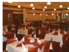
Hotel SNP*** - restauracja