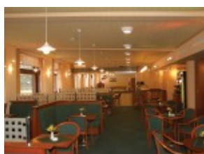
Hotel SNP*** - kawiarnia