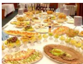
Raut w hotelu SNP***