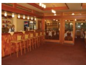
Hotel SNP*** - aperitif bar