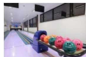
Hotel HUTNIK*** - kręgielnia

Hotel Hutnik położony jest w urokliwej i spokojnej części osady Tatranske Matliare , u podnóża Łomnickiego Szczytu, ok. 2 km od Tatrzańskiej Łomnicy - jest dobrym punktem wycieczek we wschodniej części Tatr Wysokich.