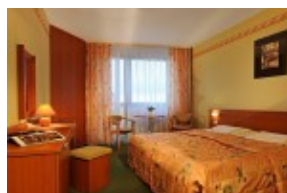
Apartament w części HUTNIK I