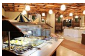
Hotel HUTNIK*** - restauracja