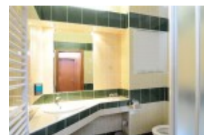
Łazienka w części HUTNIK I