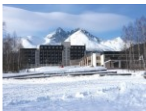
Hotel HUTNIK*** Tatranske Matliare