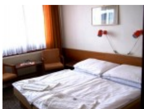
Pokój w części HUTNIK II