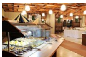
Hotel HUTNIK*** - restauracja