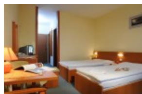
Pokój w części HUTNIK I