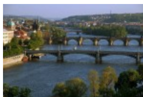
Praga - Wełtawa