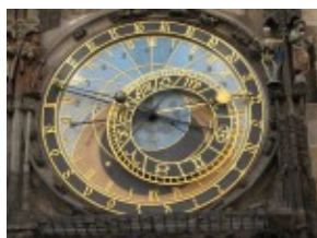
Praga - zegar Orloj