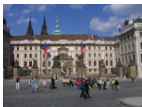
Praga - Hradczany