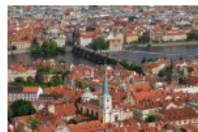
Praga - Mała Strana