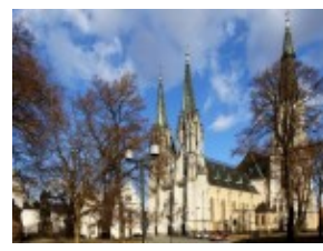
Ołomuniec - katedra