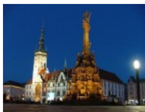
Ołomuniec - kolumna