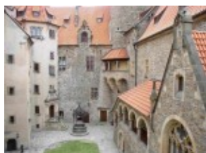
Zamek Bouzov - dziedziniec