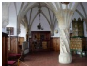
Zamek Bouzov - wnętrza