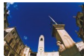
Dubrownik - wieże