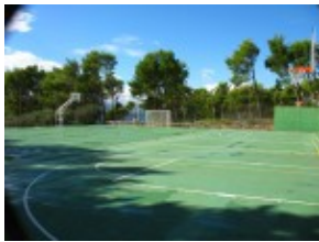
Boiska do koszykówki Hotel