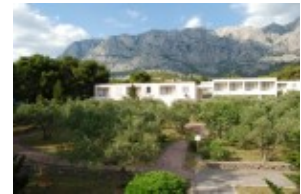
pawilony Elwira w otoczeniu zieleni