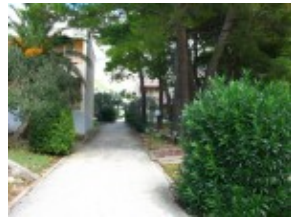
Rivijera teren zielony