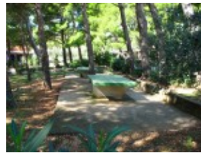
Tenis stołowy Hotel Rivijera