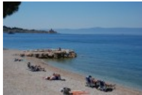
Plaža hotel Rivijera