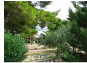
Pawilony w otoczeniu pięknej przyrody