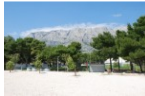
widok na boiska