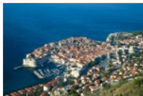
Dubrownik Stare Miasto