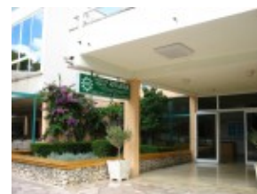
Makarska tani hotel