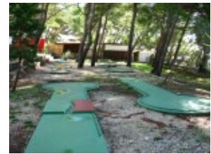
Minigolf Makarska Rivijera