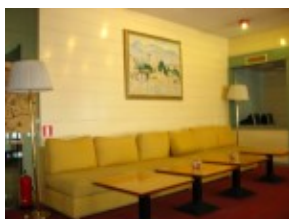
Hotel Rivijera Recepcja