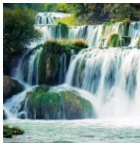
Wodospady Rzeki Krka