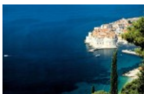
Morze i Dubrownik