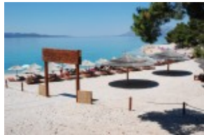
Plaža obok hotelu