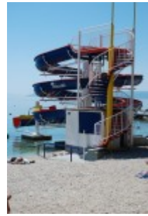
Atrakcije na plaži