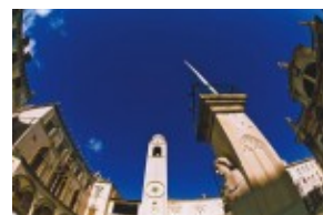
Dubrownik - wieże