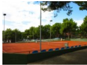
Makarska Korty tenisowe