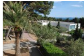
widok z ogrodu