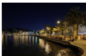
Promenada w Splicie