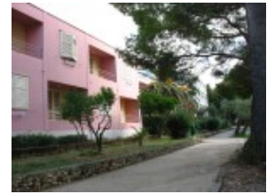
pawilon Dora i Barbara