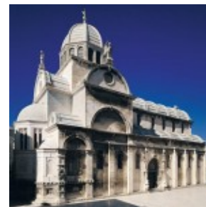
Katedra w Sibeniku