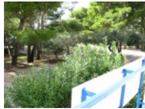
widok z balkonu