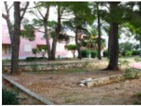
widok na pawilon Barbara i Dora