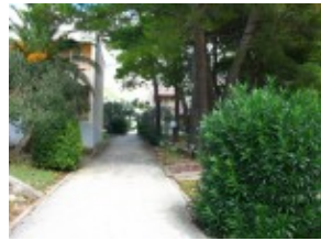
Rivijera teren zielony