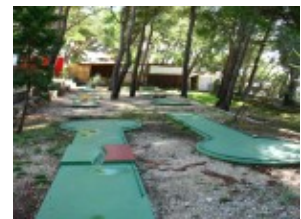
Minigolf Makarska Rivijera