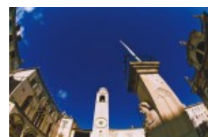
Dubrownik - wieże