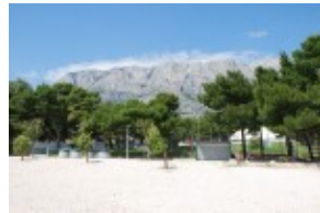
widok na boiska