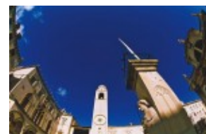
Dubrownik - wieże