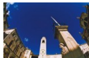
Dubrownik - wieże