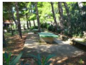
Tenis stołowy Hotel Rivijera