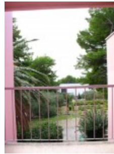
widok z pokoju