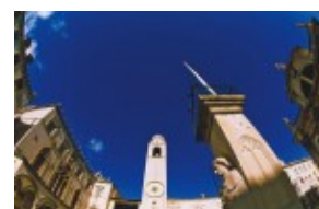
Dubrownik - wieże