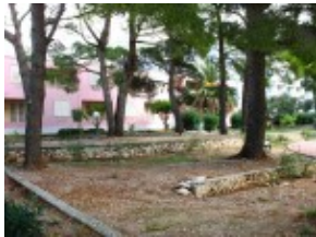
widok na pawilon Barbara i Dora