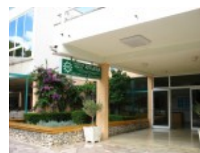
Makarska tani hotel