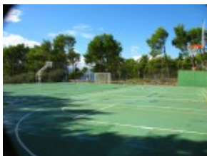
Boiska do koszykówki Hotel