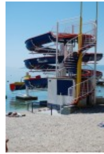
Atrakcije na plaži