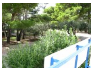
widok z balkonu