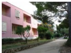
pawilon Dora i Barbara