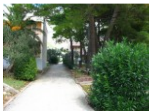
Rivijera teren zielony