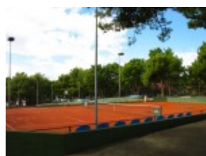
Makarska Korty tenisowe