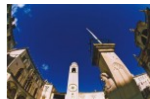
Dubrownik - wieże