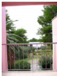
widok z pokoju