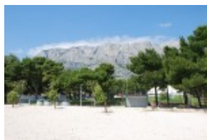
widok na boiska