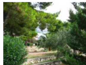
Pawilony w otoczeniu pięknej przyrody