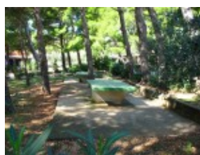
Tenis stołowy Hotel Rivijera