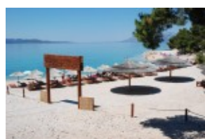
Plaża obok hotelu