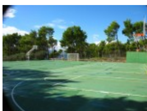
Boiska do koszykówki Hotel