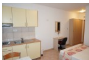
apartament studio /kuchnia