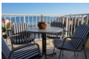
widok z balkonu