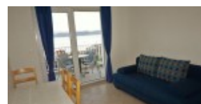
apartament - balkon widok na morze