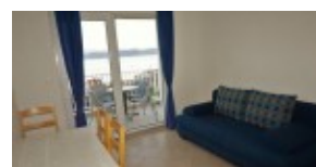
apartament - balkon widok na morze