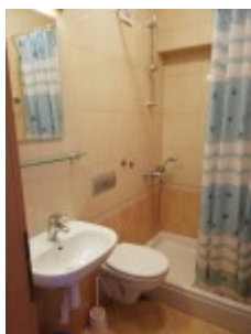
łazienka w studio A2